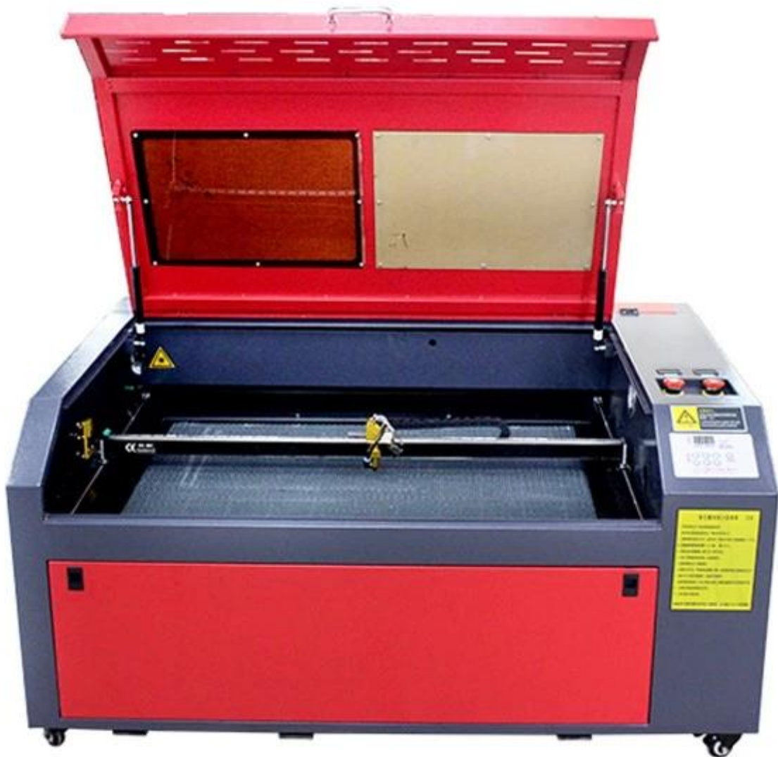
SL-6090 100W CO2 лазерный гравёр фотографии