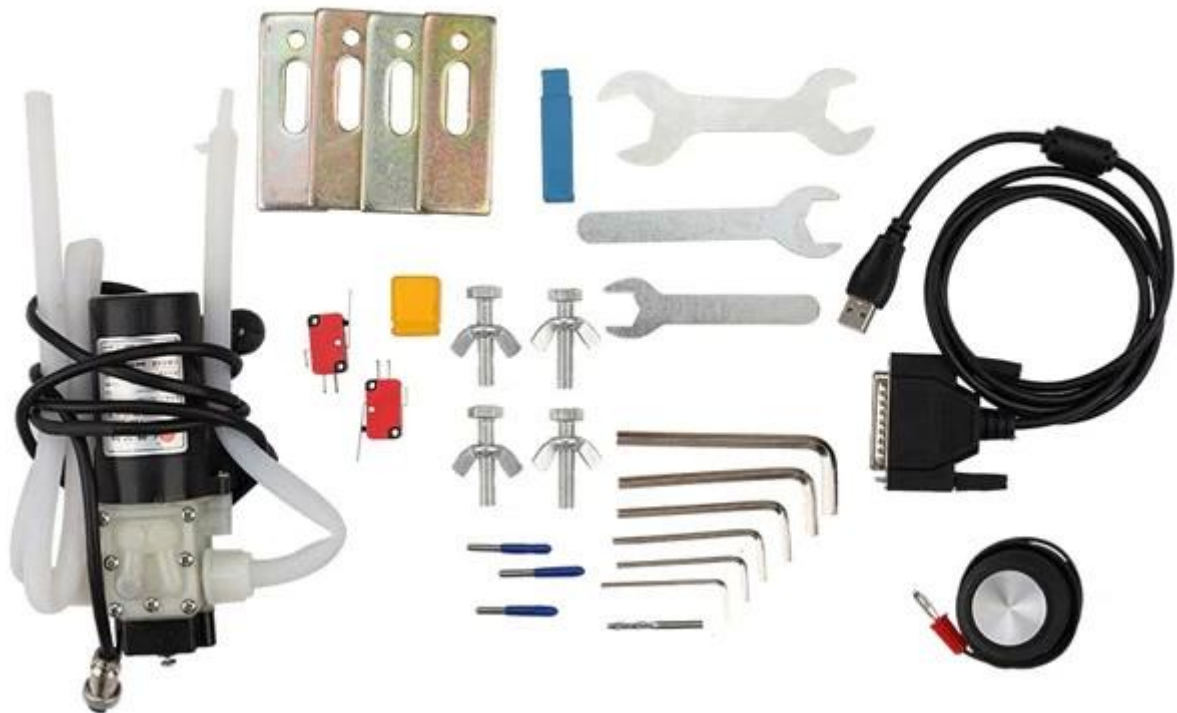
CNC 6090 Máquina 4 Axis Mini CNC Engraver