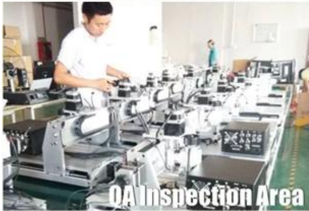
QA Inspection Area