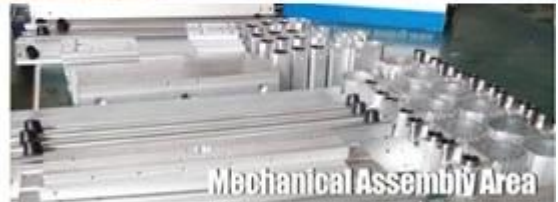
Mechanical Assembly Area