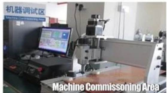
Machine Commissioning Area