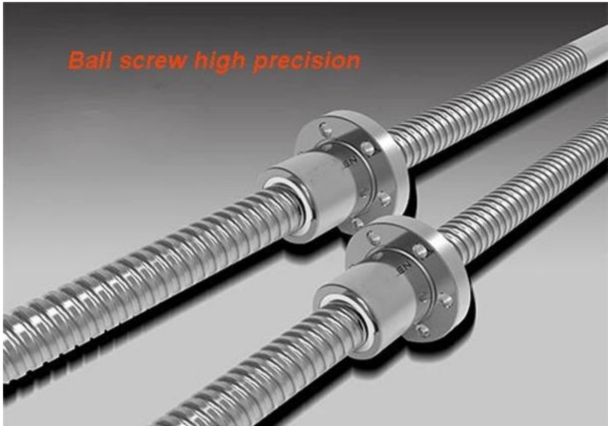
Ball screw high precision