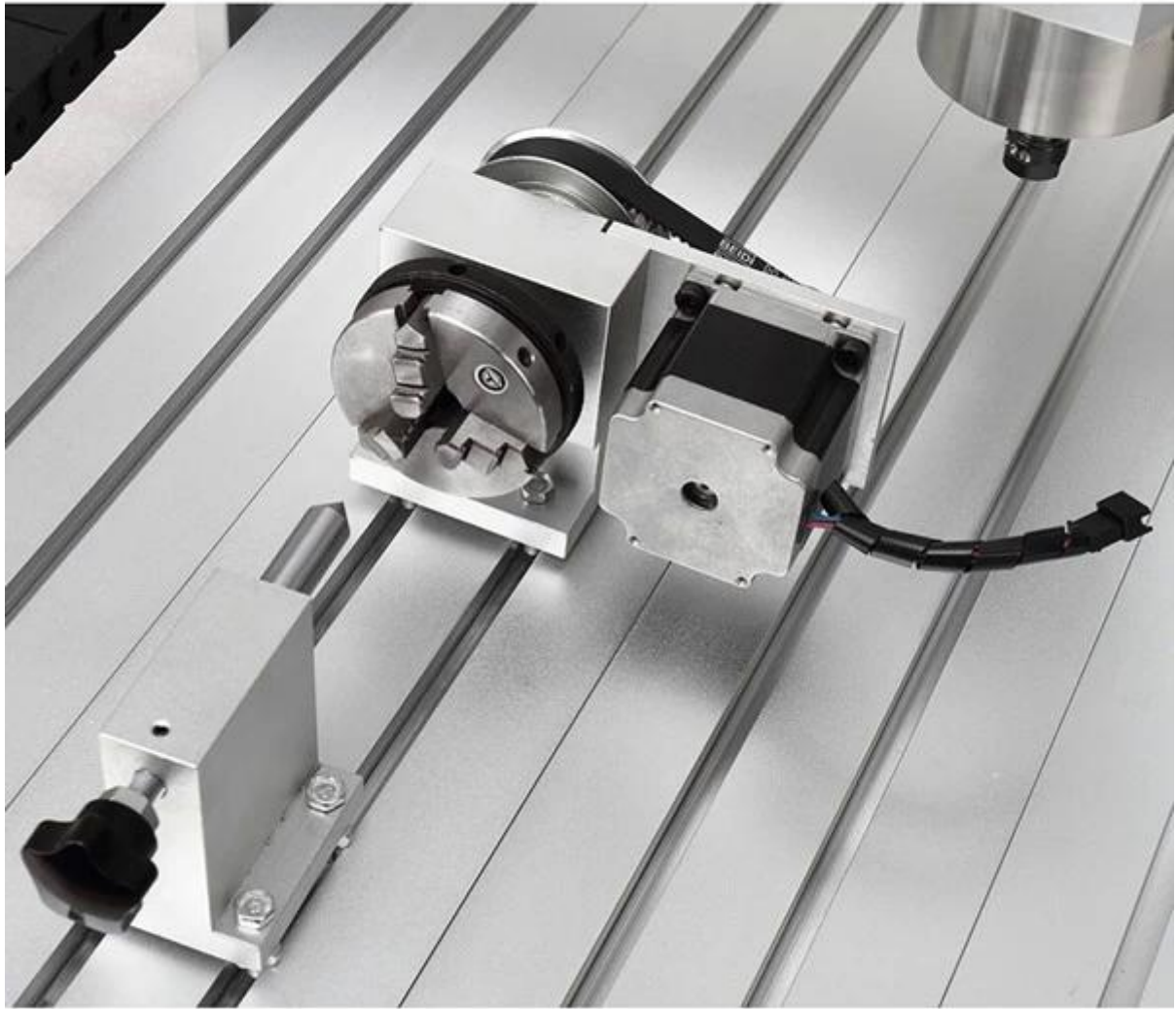
6090 CNC Router 4 as verpakking