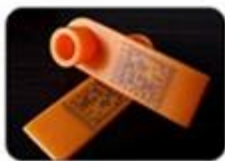
Animal Ear Tag