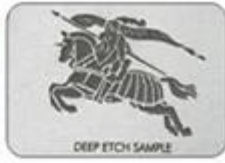
Stainless steel material