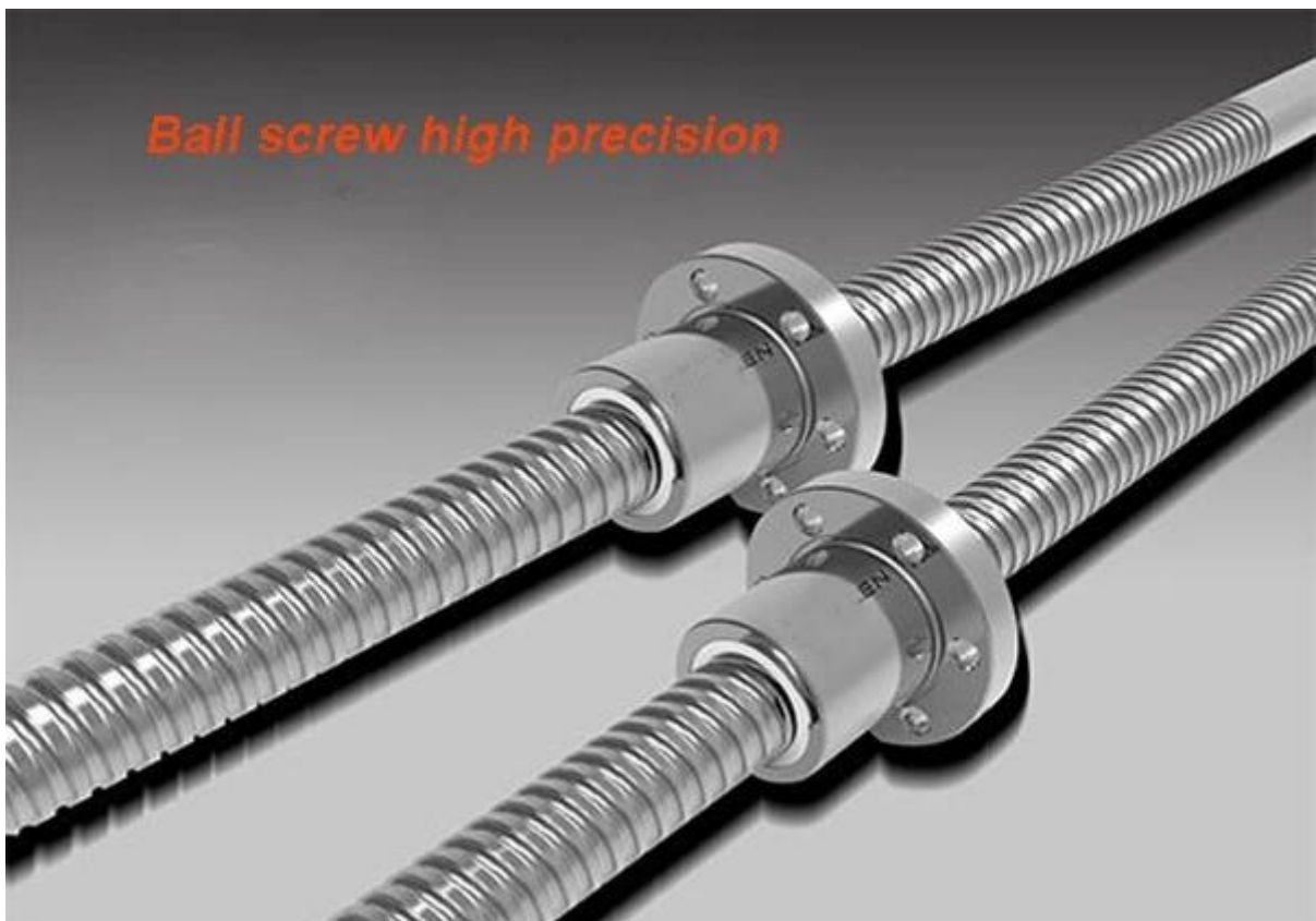
Ball screw high precision