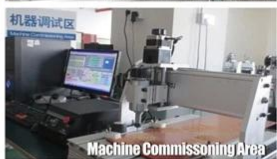
Machine Commissioning Area