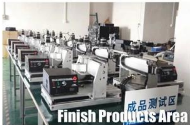
Finish Products Area