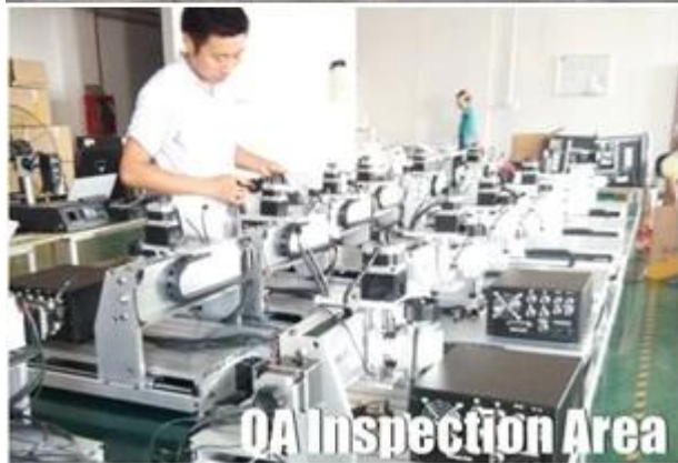
QA Inspection Area