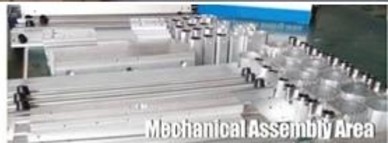
Mechanical Assembly Area